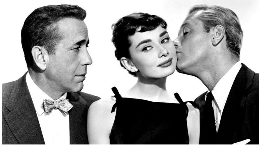
Audrey Hepburn con Humphrey Bogart y William Holden en la película Sabrina